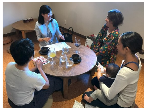
子育て中のお母さんたちの声を聴いて議会に届けています。

また小学1年生の保護者が仕事を辞めずに続けられるための支援体制の強化や、学童の待機児童の解消、小学6年生まで同じ民間学童に通える仕組みなど、子育ての実態に即した対策や、学童保育全体の環境改善を、昨年と今年の二度の議会で訴えました。